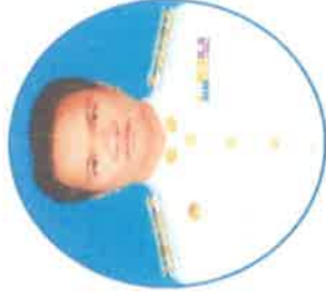
นายพล่า ชัยอาคม สภาองค์การบริหารส่วน ตำบลโพธิ์ตาก หมู่ที่ 5