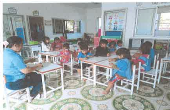
โครงการอบรมพัฒนาบุคลากรทางการศึกษา